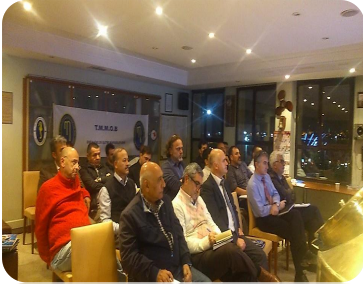
30 Ekim 2014 tarihinde Gadem TMMOB GEMİMO Bilirkişi Eğitimi

2014 yılı Bilirkişi Eğitim Semineri 30.10.2014 tarihinde Gündüz Aybay Denizcilik ve Eğitim Merkezi'nde gerçekleştirildi ve seminer sonunda katılımcı üyelere sertifikaları verildi.